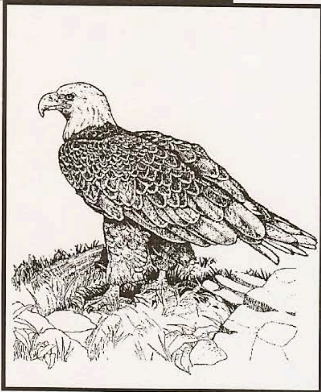
курица и орёл пти́цы